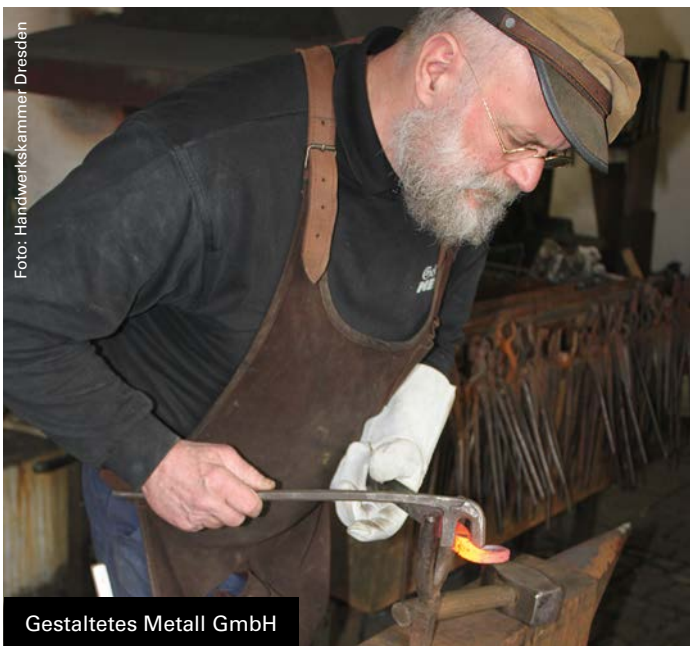
Gestaltetes Metall GmbH